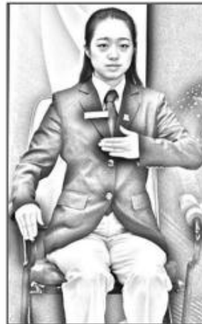
7.1 Dold av vad eller vem.