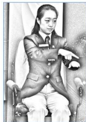
5. Innanför kortlinjen.