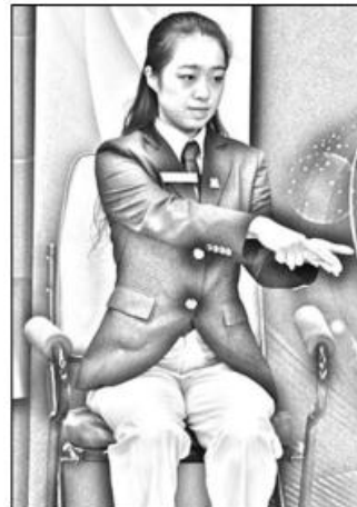
3. Bollen vilar på fingrarna.