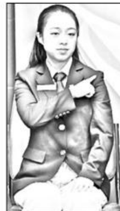
7.2 Dold av axel.