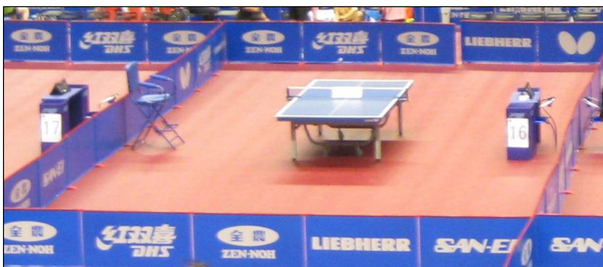
Tokyo Metropolitan Gymnasium

Hallarna hade röd matta från Gerflor/Taraflex Matchdomaren placerades i en upphöjd stol från Double Happiness, vanligt förekommande på dagens World Tour-tävlingar. Assisterande domare satt på finare modell av plaststol med vanligt manuellt räkneverk.